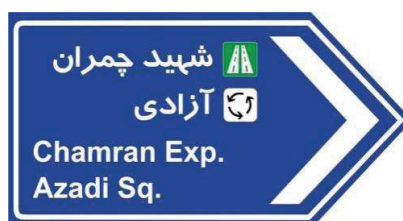
شکل ۱۱: نمونه ای از تابلوی راهنمای مسیر خروجی که در آزادراه نصب می شود

۵- چنانچه در جهت خروجی از یک معبر با درجه پایین تر (شریانی)، رمپی به یک معبر با درجه بالاتر (مثلا بزرگراه) ختم شود، ترکیب رنگ تابلوی خروجی همانند تابلوهای پیش آگاهی، از ترکیب رنگ اصلی تابلوها (زمینه سفید و نوشتار و حاشیه های سیاه) تبعیت می کند و شماره مسیر و یا لوگوی مسیر مقصد به اتفاق عبارت نام مسیر مقصد در یک کادری با ترکیب رنگ مقصد (در اینجا رنگ کادر سبز و رنگ نوشتار و لوگوی مسیر سفید) درج می شود (شکل ۱۳).