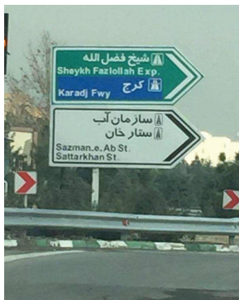
شکل ۱۰: نمونه ای از تابلوهای راهنمای مسیر خروجی نصب شده در بزرگراه جلال آل احمد شهر تهران

یکی از فواید قوانین ترکیب رنگ تابلوها، خود معرف بود تابلوهاست. بدین معنی که هرگاه راننده‌ای با تابلویی با ترکیب رنگ آبی و سفید مواجه شود، متوجه می‌شود در یک آزادراه در حال رانندگی است و موظف است خود را با شرایط آزادراه منطبق کند [۱۰]. شکل ۱۰، دو نمونه از تابلوهای راهنمای مسیر خروجی (پرچمی) که در یکی از بزرگراههای شهر تهران نصب شده است را نشان می‌دهد. اگرچه این تابلوها هر دو در یک نقطه نصب شده اند، ولی نوع ترکیب رنگ آنها، با یکدیگر متفاوت است. چرا که این تابلوها استفاده از قوانین ملاک عمل شهرداری تهران طراحی و نصب گشته‌اند و بدون در نظرگیری مکان نصب تابلوها، ترکیب رنگ تابلوها تعیین شده است. این تفاوت در ترکیب رنگ‌ها، اصل خود معرف بودن ترکیب رنگ تابلوها را زیر سوال می‌برد. یعنی راننده با دیدن این تابلوها نسبت به محل رانندگی خود (آزادراه، بزرگراه و غیره) دچار سردرگمی می‌شود.