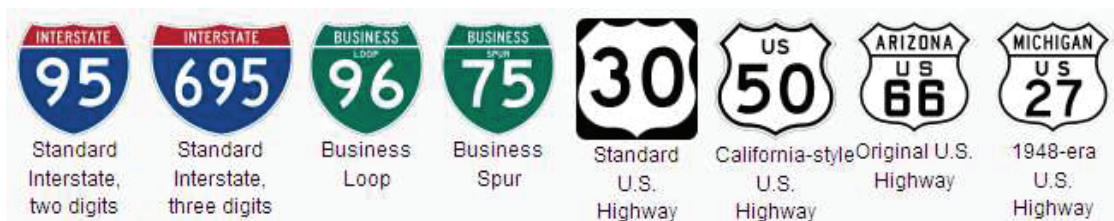
شکل ۳: نمونه‌هایی از نماد و شماره مسیر در [5] MUTCD