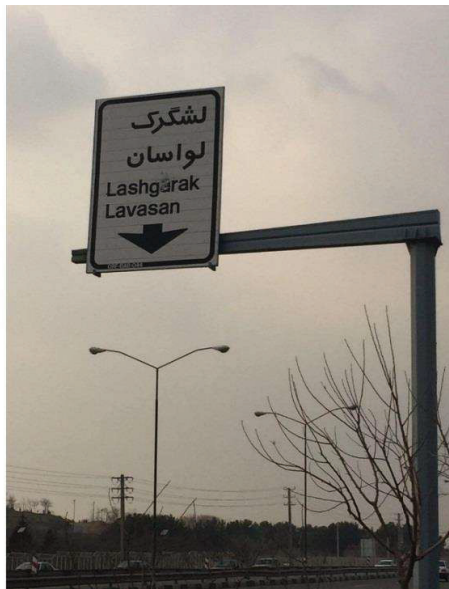
شکل ۸: نمونه هایی از تابلوهای راهنمای مسیر خروجی نصب شده در بزرگراه شهید بابایی تهران (زمینه سفید، نوشتار سیاه)

شکل ۸، دو نمونه از تابلوهای راهنمای مسیر خروجی نصب شده در بزرگراه شهید بابایی تهران را نشان می‌دهد. علی‌رغم نصب این تابلوها در بزرگراه، ترکیب رنگ آن‌ها از ترکیب رنگ بزرگراهی (زمینه سبز و نوشتار سفید) تبعیت نمی‌کنند و از آنجایی که طراحی آن‌ها مطابق دستورالعمل ملاک عمل شهرداری تهران صورت گرفته است، از ترکیب رنگ مقصد که معبری شریانی است (زمینه سفید و نوشتار سیاه)، تبعیت می‌کنند.