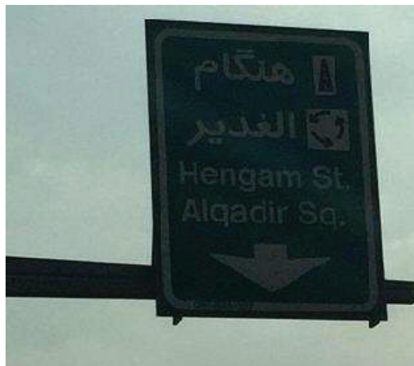
شکل ۹: نمونه ای از تابلوی راهنمای مسیر خروجی نصب شده در بزرگراه شهید بابایی (زمینه سبز، نوشتار سفید)

مطابق شکل ۷، معیارهای رفتار رانندگان (C) و زیبایی شناسی (D)، اگرچه دارای اهمیت بالایی در قوانین ترکیب رنگ تابلوهای راهنمای مسیر می باشند، اما دارای وزن‌های کمتری نسبت به دو معیار دیگر می باشند. ترکیب رنگ تابلوهای راهنمای مسیر می‌بایست متناسب با شرایط روحی و رفتاری رانندگان در نظر گرفته شود.