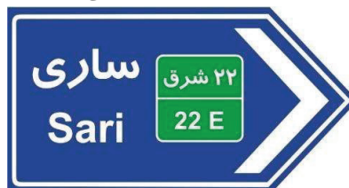
شکل ۱۲: نمونه ای از تابلوی راهنمای مسیر خروجی که در آزادراه نصب می شود