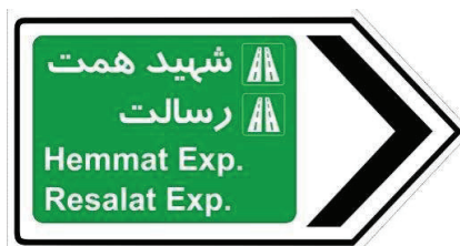
شکل ۱۳: نمونه ای از تابلوی راهنمای مسیر خروجی که در یک مسیر شریانی نصب می شود