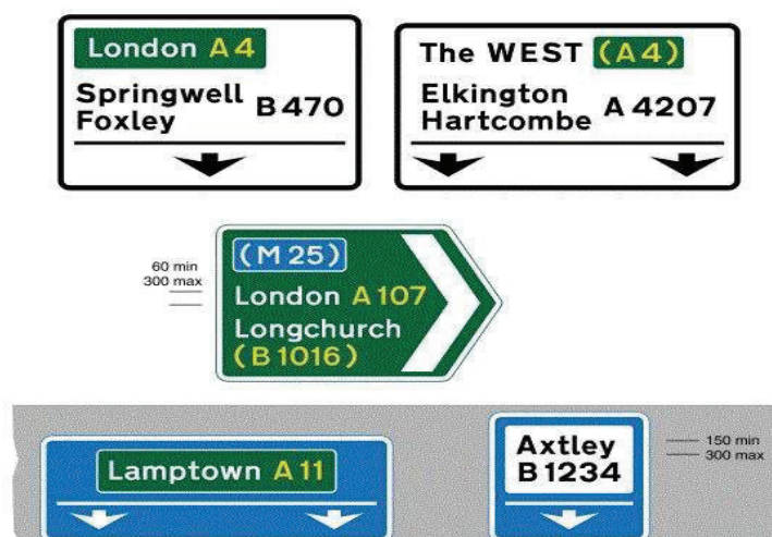
شکل ۴: نمونه هایی از تابلوهای خروجی در آیین نامه [۶] TSRGD

در شکل ۴، چند نمونه تابلوی خروجی نمایش داده شده است که در آنها، سیستم ترکیب رنگ اصلی تمامی تابلوها از محل نصب تابلوها تبعیت می‌کند و چنانچه نوع معبر خروجی، معبری متمایز از نوع معبر اصلی باشد، نام معبر به همراه نماد و شماره معبر در درون کادری با ترکیب رنگ معبر مقصد قرار می‌گیرد.